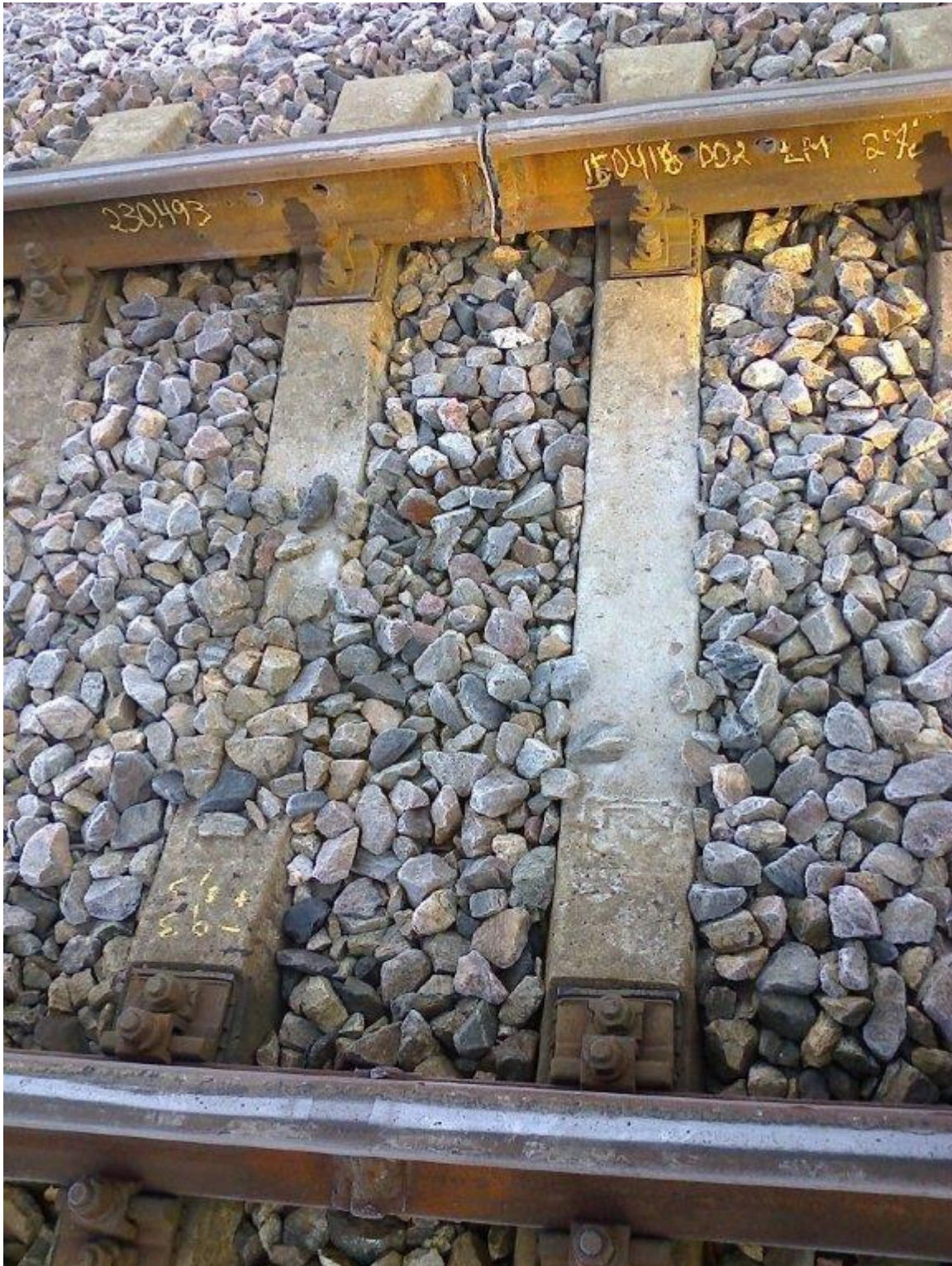
Foto 1. Rööpamurd 28.12.2015 termiitkeevises Kabala – Sonda jaamavahel km 229 pk 6

Esimesena purunes aastavahetusel termiitkeevis Kabala – Sonda jaamavahel, mis oli teostatud 08.06.2015. Seda ilmestab järgmine foto: